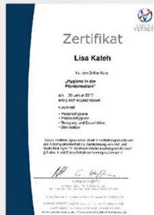
Ihr Zertifikat nach abgeschlossenem Kurs als PDF-Download